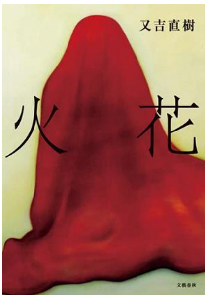
『火花』 © 又吉直樹／文藝春秋

2015年の年間ランキングは、お笑いコンビ「ピース」又吉直樹による感動作『火花』が、総合1位・小説部門1位を獲得しました。第153回芥川賞受賞、ドラマ化・映画化の決定など、今年話題が尽きなかった本作品。読後の評価が高いこともあり、現在も継続的な人気を得ています。